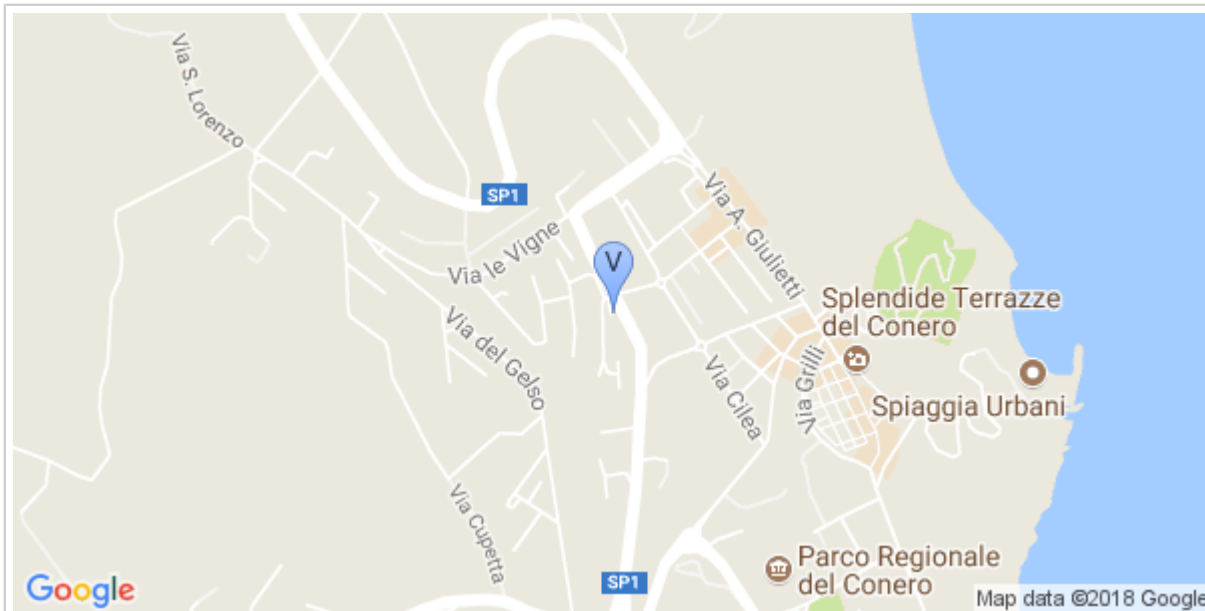
Ad 8 minuti dal Mare