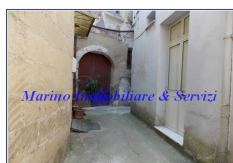
Marino Immobiliare & Servizi

La Marino Immobiliare propone in vendita in Pignataro Maggiore una soluzione semindipendente a pochi passi dalla piazza principale composta da: piano terra una cucina, piano primo due stanze da letto con bagno. I.P.E. 192 Kwh/mq.2 C.E. G Vi attendiamo per una visita immobiliare Contattaci per questa vendita allo 0823.653111 oppure 349.7593630